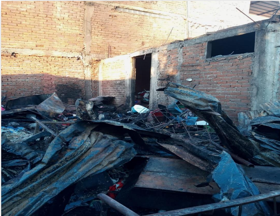
Daños materiales en viviendas