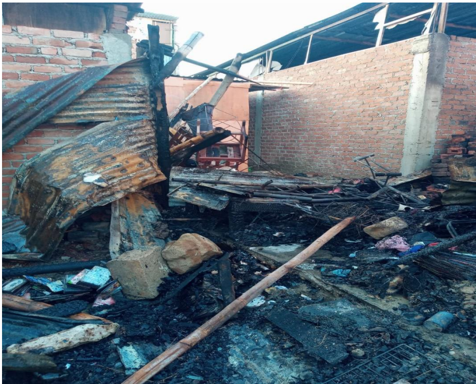
Daños Materiales en viviendas.