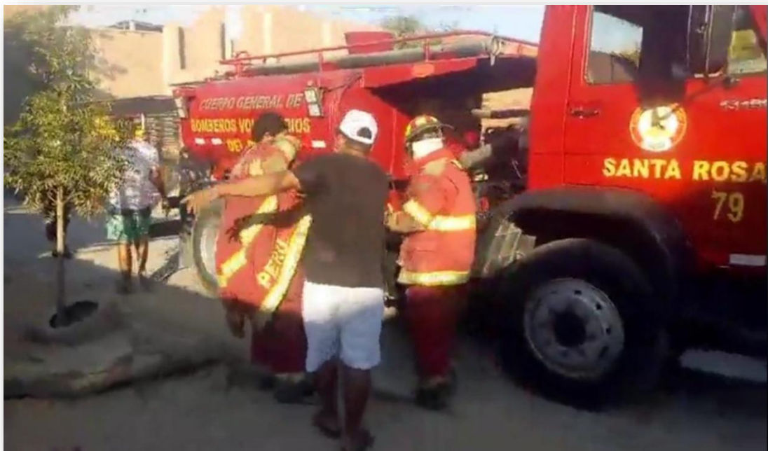
Llegada de personal de bomberos - Compañía N° 79 Santa Rosa